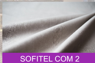
SOFITEL COM 2