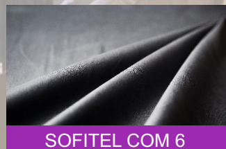
SOFITEL COM 6