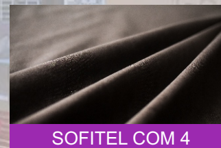
SOFITEL COM 4