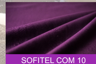
SOFITEL COM 10

Безупречная ткань для совершенного интерьера!