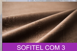
SOFITEL COM 3