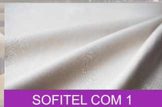
SOFITEL COM 1