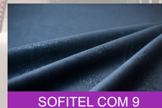
SOFITEL COM 9