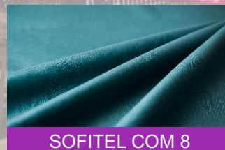
SOFITEL COM 8