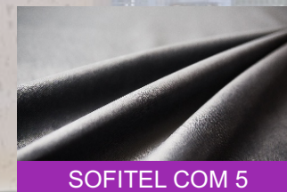
SOFITEL COM 5