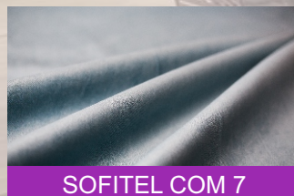
SOFITEL COM 7